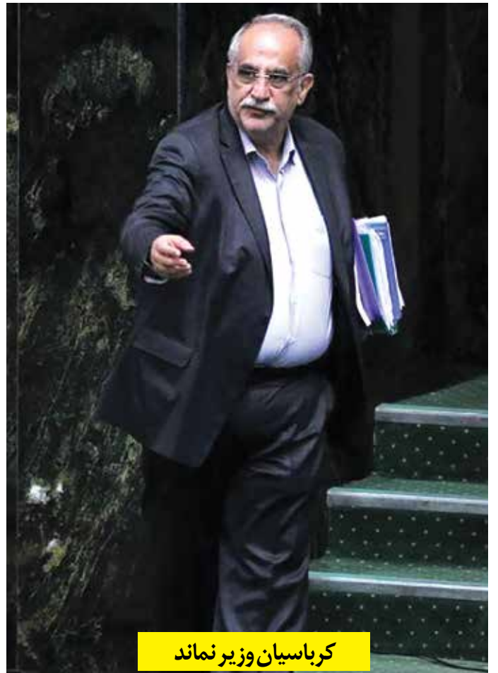
کرباسیان وزیر نماند

رئیس اتاق بازرگانی ایران معتقد است که همه با برخورد جدی با محتکران موافق هستند و اتاق بازرگانی ایران نیز از آن استقبال می‌کند اما این فرایند باید به دور از فضای امنیتی شکل بگیرد و مشکلی برای بازرگانان به وجود نیاید. طبق بسته جدید ارزی و همچنین مصوبه اخیر دولت برای پرداخت مابه‌التفاوت ارزی از سوی واردکنندگانی که کالاهایشان وارد شده اما در فهرست کالاهای اساسی قرار ندارد که ارز ۴۲۰۰ تومانی بگیرند، باید برای ترخیص محموله خود مابه‌التفاوت ارز ۴۲۰۰ تومانی تا بازار ثانویه را پرداخت کنند. در این میان اظهارنظرهای فراوانی صورت گرفت و انبوهی از اعتراض‌ها به عنوان احتکار پلمب شد. در این باره غلامحسین شافعی - رئیس اتاق بازرگانی ایران اظهار کرد: ما نیز بارها اعلام کرده بودیم که باید مابه‌التفاوت ارزی